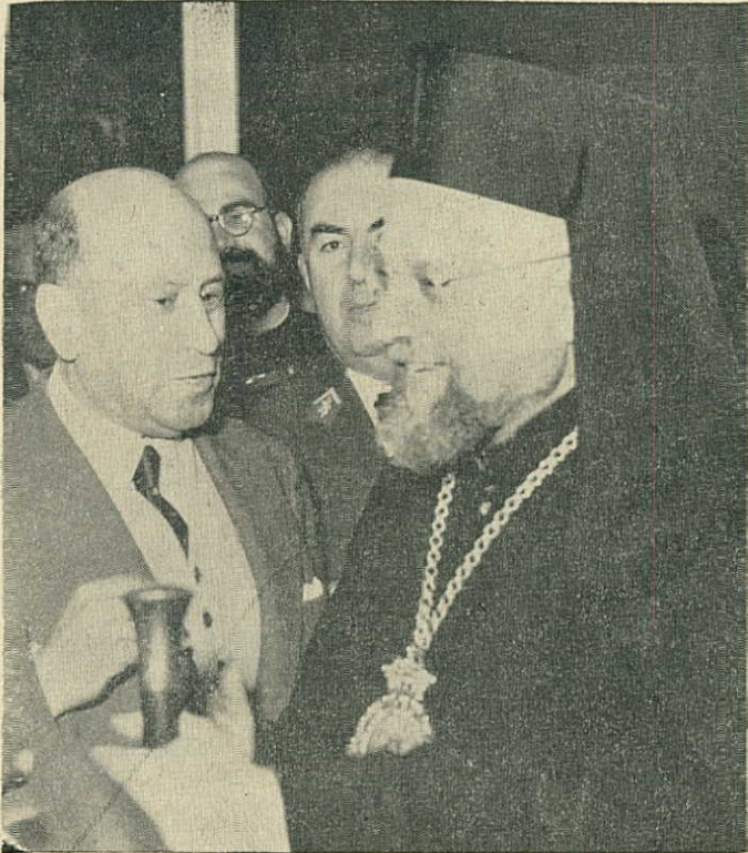
هنري بك فرعون يهني، متروبوليت بيروت بيبليه الكهنوتي